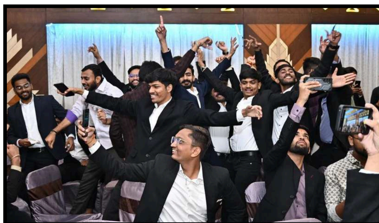
Students of 4th Semester ( Batch 2023-25)